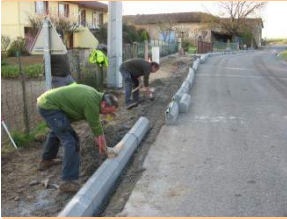
Chemin piéton, rue de l'église