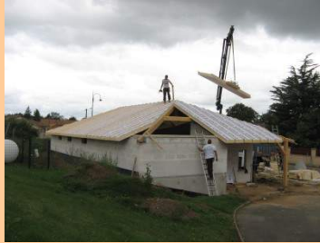
Bibliothèque en construction