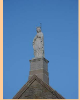
Avez-vous remarqué sa beauté !!!